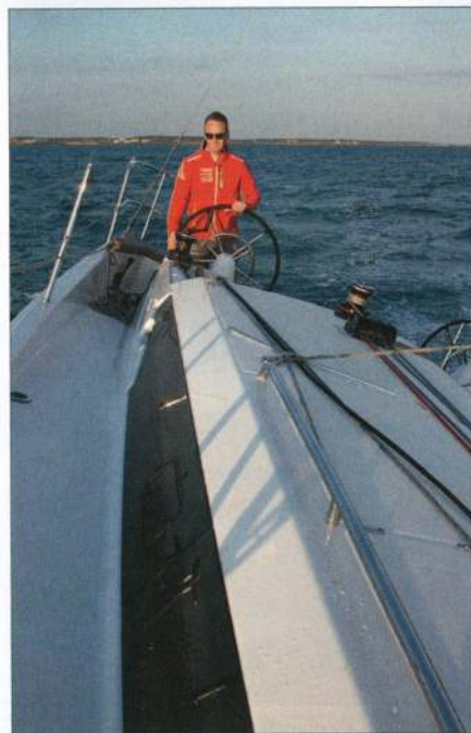
▲ Comme sur les Sun Odyssey 440 et 490, les passavants descendent jusqu'au fond de cockpit.