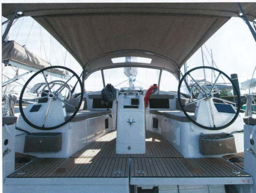
▲ En configuration bimini-capote, le cockpit augmenté de la large plateforme de baignade joue le rôle d'une pièce à vivre supplémentaire au port ou au mouillage. Les barres n'entravent pas la circulation.

“ Le livet chanfreiné adoucit les formes et fait passer les bordés verticaux. ”