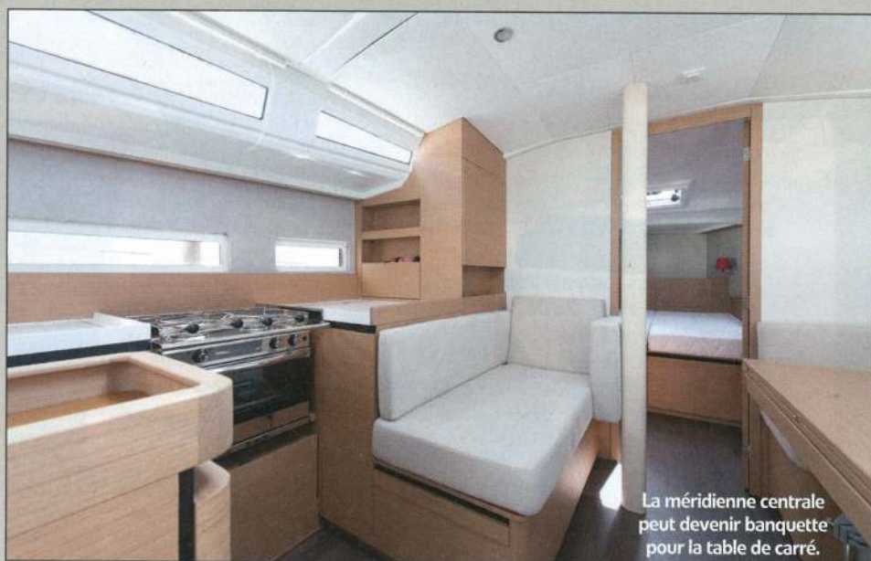
La méridienne centrale peut devenir banquette pour la table de carré.